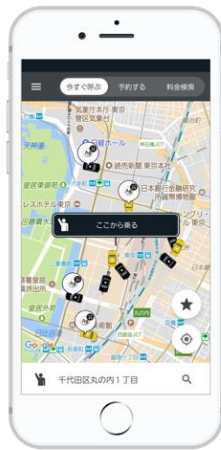
「全国タクシー」配車画面（画像はイメージです）