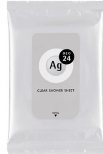
エージーデオ24 クリアシャワーシート Na